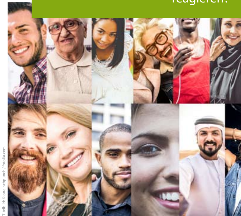
Titelbild © oneinchpunch / fotolia.com

Wie kann das Gesundheitswesen auf Interkulturalität, Gender und Diversität in der Gesellschaft reagieren?